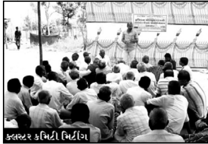
કલરટર કમિટી મિટીંગ